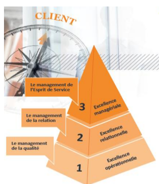
Figure 1 : Les trois concepts de base d'Esprit de Service.

Esprit de Service se fonde sur trois concepts de base (voir Figure 1). Le premier, c'est que l'humain (le client, le collaborateur, les parties prenantes, l'environnement) est au centre de la démarche : confiance, respect, bienveillance, care , ouverture à l'autre, relation, apprenance, intérêt à agir, "Co" (collaboration, coopération, cocréation, etc.), open innovation , externalités positives.